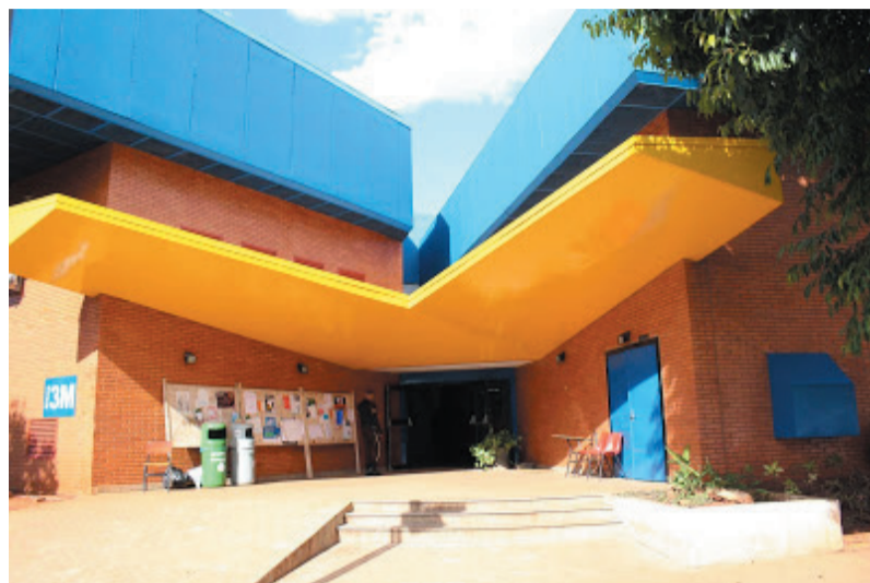
Instituto de Artes está instalado no Campus Santa Mônica.