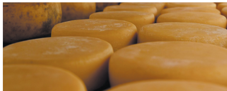
No momento, em toda Minas Gerais, 40 queijarias estão registradas com Selo Arte